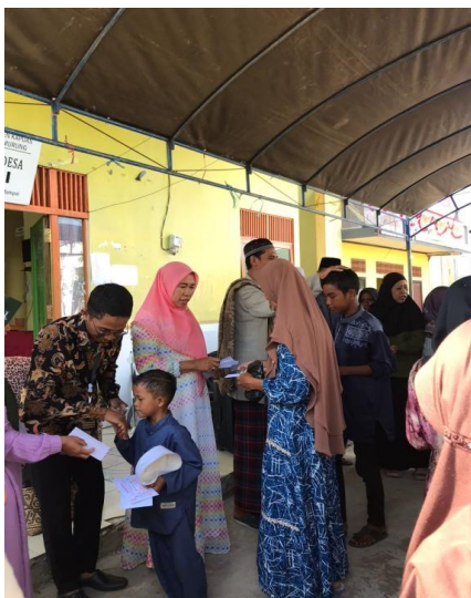
Gambar 2. Mengusap Rambut/Kepala Anak Yatim dan Membagikan Santunan

Santunan anak yatim pada tahun ini dapat menyalurkan dana kepada 34 anak dengan total Rp. 4.250.000. Masyarakat Desa Mampai memiliki tingkat kepedulian yang baik kepada anak yatim. Kepedulian tersebut dilihat dari partisipasi masyarakat dalam memberikan sumbangan seiklasnya. Kerja sama panitia yang baik membuat kegiatan tersebut berlangsung dengan sukses dan lancar.