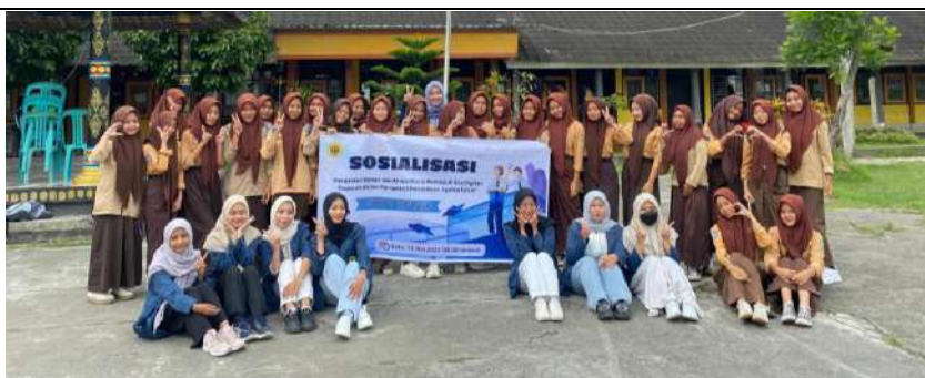
Gambar 5. Foto bersama peserta

Kegiatan diakhiri dengan sesi dokumentasi bersama sebagai bentuk apresiasi atas partisipasi aktif seluruh peserta dan pihak sekolah dalam menyukseskan program ini.