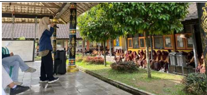
Gambar 1. Penyampaian Materi Pergaulan Bebas dan Krisis Moral dalam Perspektif Islam

Berdasarkan Gambar 1, terlihat antusiasme siswa dalam menyimak materi yang nilai-nilai Islam dalam meningkatkan kesadaran siswa terhadap dampak negatif pergaulan bebas dan krisis moral. Metode ceramah interaktif ini terbukti efektif menarik perhatian siswa, di mana mereka diberikan ruang untuk berefleksi mengenai kondisi moral di era digital saat ini.