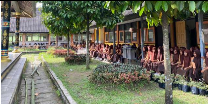
Gambar 3. Peserta kegiatan sedang menyimak presentasi dari narasumber