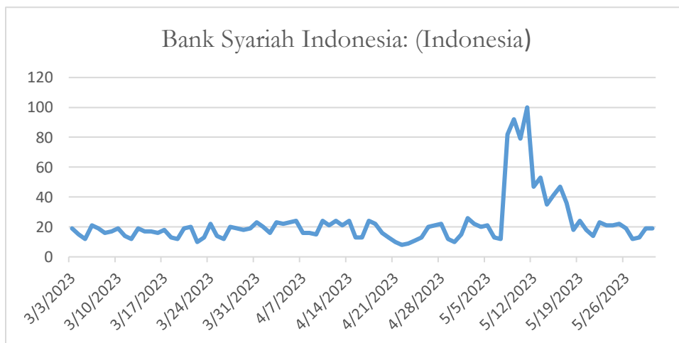
Gambar 3. Teks Pencarian Bank Syariah Indonesia di Google Trend

Melihat fenomena ini, masyarakat yang paling berdampak ialah Daerah Istimewa Aceh, hal ini dikarenakan terdapat Qanun yang harus dipatuhi masyarakat sekitar untuk menggunakan bank syariah dalam melakukan aktivitas ekonomi. Sehingga pencarian Bank Syariah Indonesia meningkat ketika momen sistem bank down dengan pencarian lebih dari 100. Menurut Geah (2017) kejadian viral terjadi dikarenakan terjadi emosi antar pengguna sehingga sebuah pesan dibagikan ke media sosial. Penelitian telah menunjukkan bahwa individu lebih cenderung berbagi pesan yang menarik emosi yang membangkitkan gairah tinggi. Emosi gairah tinggi dicirikan sebagai keadaan rangsang dari peningkatan aktivitas terutama pada kejadian viral BSI down (Geah, 2017).